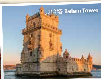
貝倫塔 Belem Tower