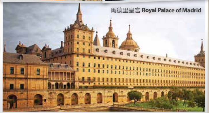
馬德里皇宮 Royal Palace of Madrid