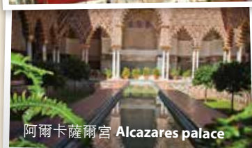
阿爾卡薩爾宮 Alcazars palace