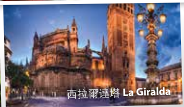
西拉爾達塔 La Giralda